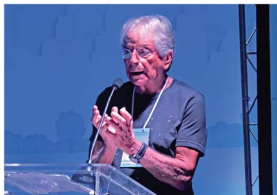
Fernando Gabeira: "Considero a falta de saneamento uma das grandes falhas da política brasileira"

Segundo Gabeira, tributos pagos pelo uso da água devem existir e serem totalmente revertidos para a recuperação das bacias hidrográficas e manutenção dos rios brasileiros. "É ilusão pensar que se a chuva cair, o problema hídrico fica resolvido. A política sobre os recursos hídricos é importante para garantir o abastecimento e a igualdade de todos ao acesso a este bem fundamental para a vida", destacou.