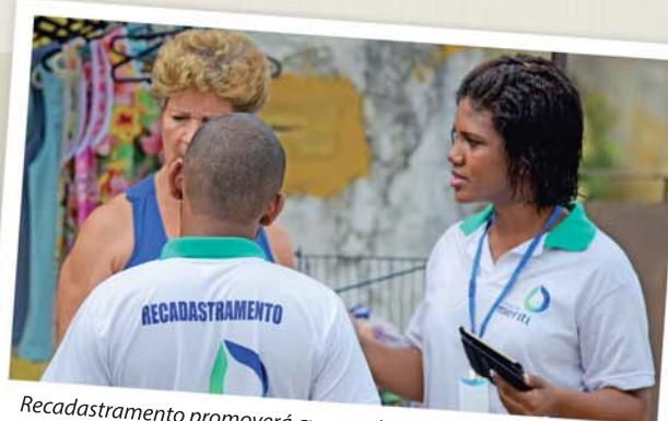
Recadastramento promoverá avanço dos serviços de saneamento

Segundo o Plano Municipal de Saneamento existem aproximadamente 148 mil imóveis na cidade, com taxa de urbanização de 100%. Nos próximos cinco anos, serão investidos R$ 175 milhões na ampliação do sistema de esgotamento sanitário, garantindo que 90% da população tenha acesso ao serviço.