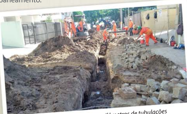
Bairro Centro terá mais 17 quilômetros de tubulações

O bairro Centro em Itapema/SC terá, até o final deste ano, mais 17 quilômetros de tubulações de esgoto para coleta e tratamento. As obras, iniciadas pela Conasa Águas de Itapema em abril, vão percorrer várias ruas do bairro durante os próximos meses. As obras integram os novos investimentos definidos pelo Plano Municipal de Saneamento.