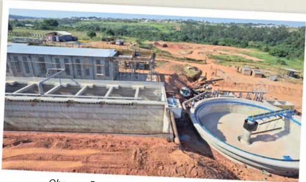
Obras na Estação de Tratamento Santa Isabel

A Conasa Sanesalto deve finalizar nesse semestre a implantação de um novo sistema de pós-tratamento de esgoto na Estação de Tratamento Santa Isabel. Os novos tanques permitirão a devolução ao Rio Tietê de água com até 95% de eficiência na remoção da carga orgânica do efluente tratado. O sistema, que substituirá o atual, vai incluir tanques de aeração e decantador secundário. Os investimentos que atendem à política de responsabilidade ambiental da Companhia e que superam R$ 13 milhões, foram estimulados pelo aumento na demanda de esgoto gerado no município.