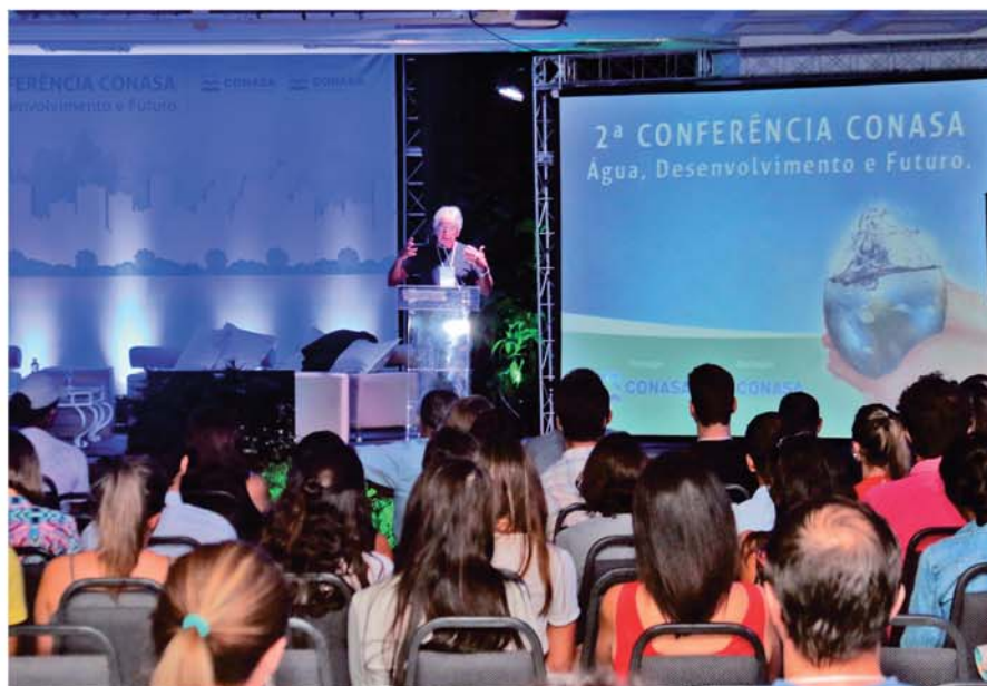
Conferência em Itapema

Evento reuniu lideranças em Itapema/SC para debater “Água, Desenvolvimento e Futuro”