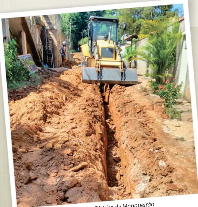
Obra no Distrito de Mangueirão

A Conasa Águas de Santo Antônio iniciou a implantação do Sistema de Abastecimento de Água no Distrito de Mangueirão, compreendendo Captação, Tratamento, Reservação, Redes de Distribuição e padronização das ligações domiciliares em todas as residências do distrito com novos cavaletes padronizados. O reservatório terá capacidade para 40 mil litros de água tratada, contando com sistema de desinfecção e fluoretação no centro da reservação de água. Os investimentos são superiores a R$ 82 mil.