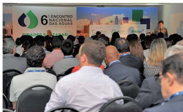
6º ENA, realizado em São Paulo

Diretores da Conasa participaram do 6º Encontro Nacional das Águas realizado nos dias 12 e 13 de abril pelo Sindcon e Abcon, em São Paulo. As discussões estiveram envoltas ao saneamento básico como investimentos urgentes e prioritários para o País.