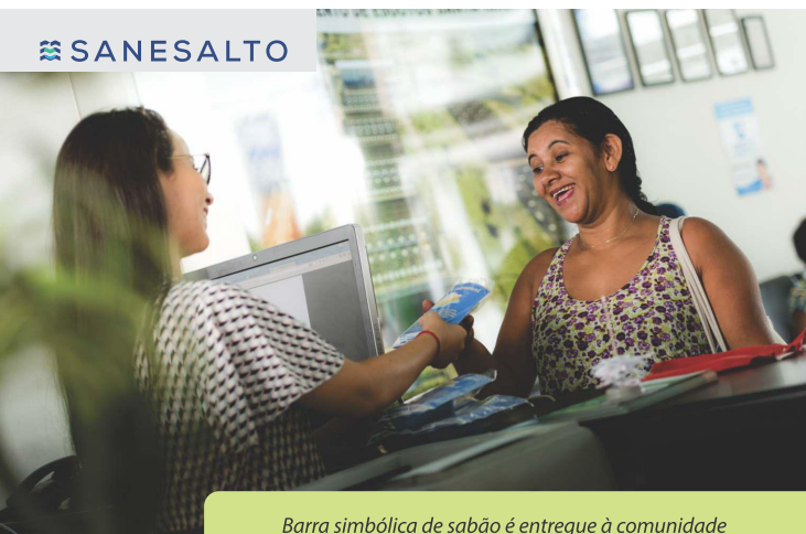
Barra simbólica de sabão é entregue à comunidade