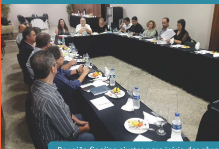
Reunião finaliza ajustes para início das obras

Encontro estratégico para planejamento final das ações reuniu Concessionária, Poder Concedente, Agência Reguladora e Verificador Independente